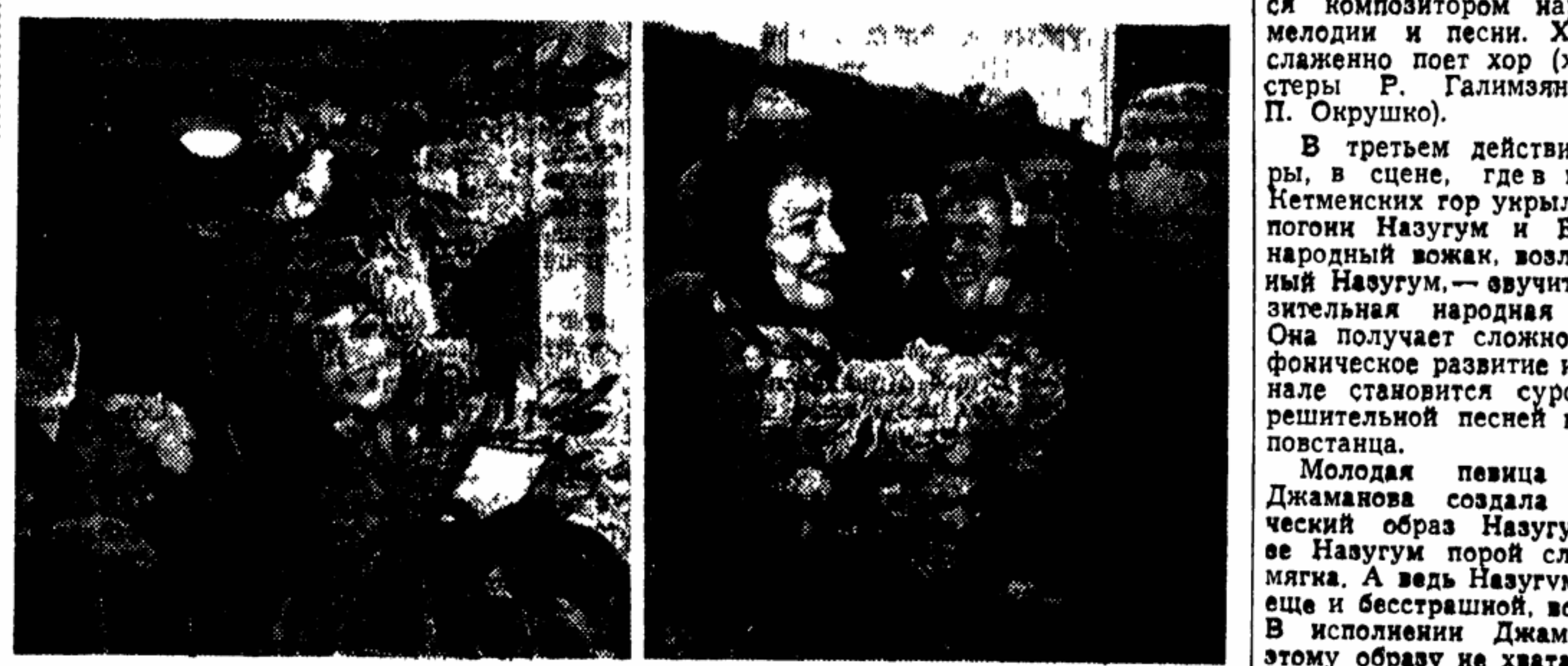
Радушно встречали вчера москвичи итальянских гостей

Радушно встречали вчера москвичи итальянских гостей — кинорежиссеров, актеров, руководителей кинофирм, прибывших в столицу на Неделю итальянского кино. В Московском доме кино, где состоялось торжественное открытие недели, собрались горячо приветствовали киноработники Италии, многие из которых хорошо известны нашим зрителем по фильмам, демонстрировавшимся в Советском Союзе.